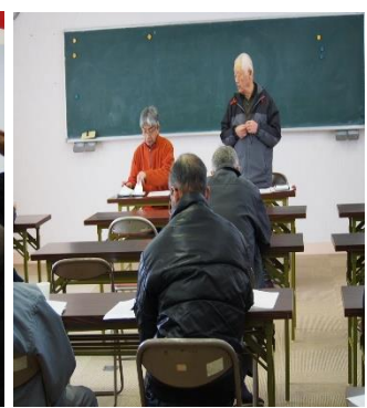
↑グラウンドゴルフ総会