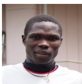
ポールカマイシ選手