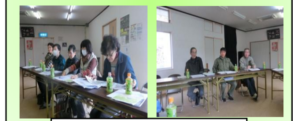
地域づくり計画策定会議 27.2.10