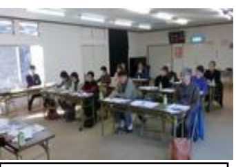
自然体験 講演会 27.1.20